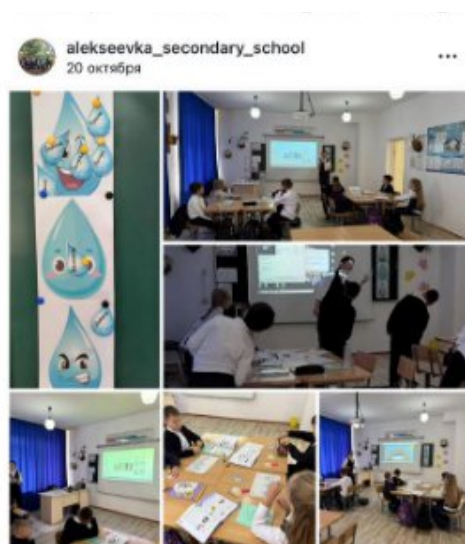
Информационный час «Республика – моя гордость» / Аскербаева Р.К