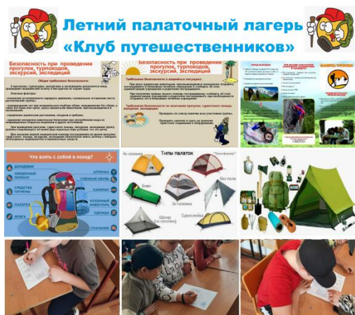
Ознакомление учащихся с правилами работы ЛПЛ. Проведение инструктажа по ТБ.