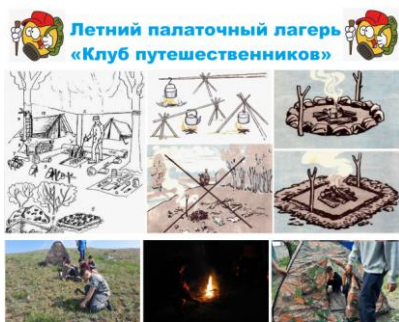
Правила обустройства палаточного лагеря и привала в турпоходе